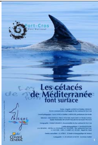
Les cétacés de Méditerranée font surface