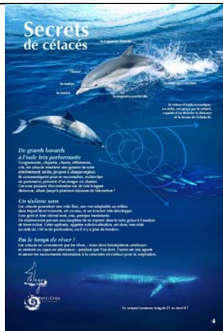
Secrets de cétacés