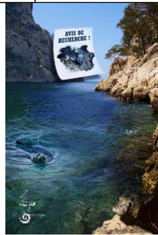
Le phoque moine