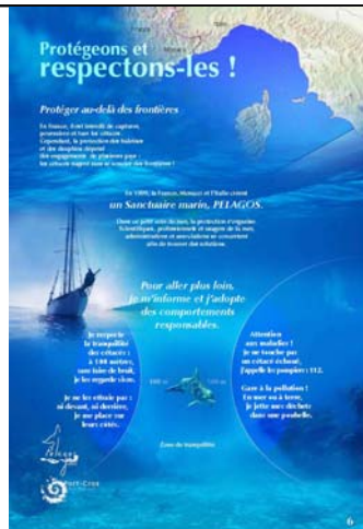
Protégeons et respectons-les