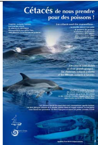
Cétacés de nous prendre pour des poissons !