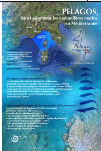
PELAGOS, Sanctuaire pour les mammifères marins en Méditerranée